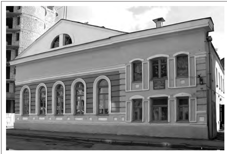
Здание бывшей «Купеческой» синагоги. Сегодня здесь размещается клуб бокса.

Вот какие нюансы ему удалось еще выведать: «В других городах СССР имеются синагоги и раввины, а в Могилеве — нет. «Мацу» нет где выпекать, а если и печем «Мацу», то не более, как в двух домах и при этом не можем соблюдать все религиозные требования». «Верующие не могут удовлетворить потребности в «кошерном мясе»