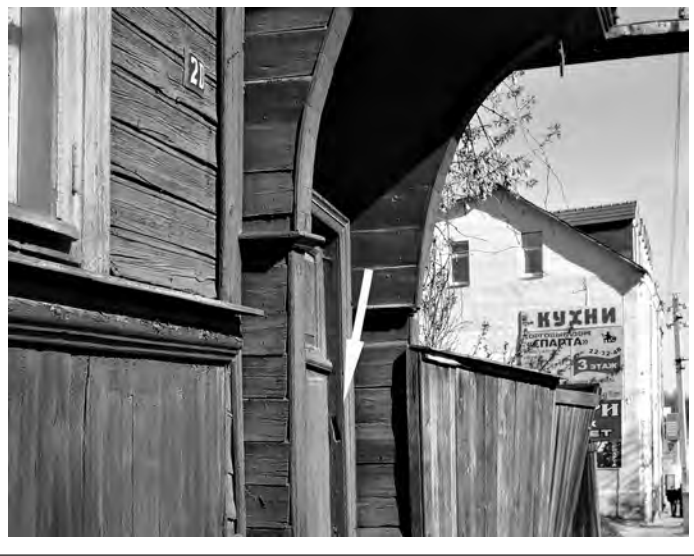
Бывший еврейский дом на Быховской улице, на косяке которого хорошо видно место от находившейся здесь мезузы.