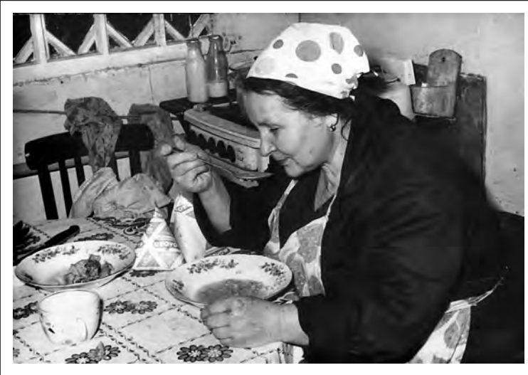
Короткий «перекус» во время работы.

Об отце мы ничего не знали. Одна цыганка гадала маме в Перми и сказала, что отец жив,