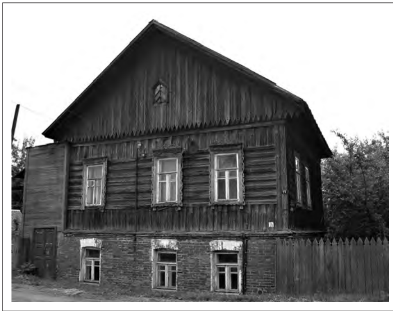
Старый купеческий дом на ул. Садовой.