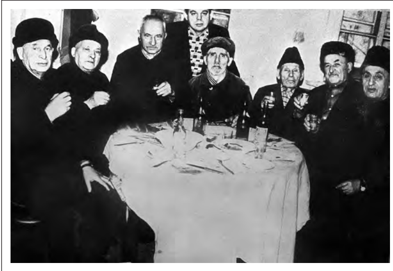
Могилевские старики после миньяна. Фото 60-х гг. XX в. из семейного архива Рыжова Э.И.

«Белвест», а раньше аптека. Это был чей-то частный деревянный домик, но евреев туда собиралось много. Много было и детей. Мне тогда, наверное, не было и десяти лет, но я с большим интересом наблюдала, как дед накидывал на себя талес, надевал также коробочки-твилы и молился. Ну а для нас, детей, важно было, что никогда оттуда без угощения не уходили.