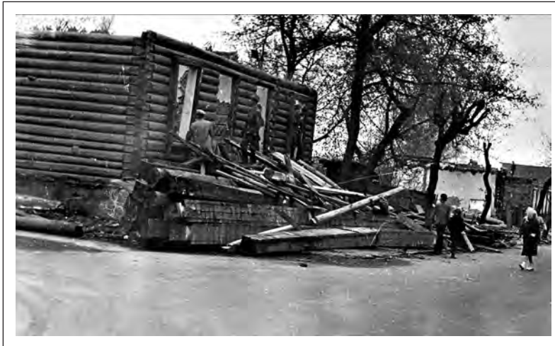
Снос бывшей еврейской больницы на ул. Миронова. Фото 70-х гг. XX в.

По отчетам можно проследить, как менялось количество религиозных евреев в Могилеве со временем, по крайней мере, по оценкам самих уполномоченных. Так, в 1955 г. их было около 700 человек, в 1957 г. — 600 (д.13), а в 1959 г. — только 250. Кроме того, по утверждению уполномоченного, «в результате проведенных партийными и советскими органами мероприятий в марте — мае 1959 г. миньяны прекратили свое существование» (д.15). Тут явно желаемое выдавалось за действительное, тем более что в отчете за 1960 г. без тени смущения сообщалось о сохранившемся в городе на 01.01.1961 г. одном миньяне (д.18). Вероятно, «сверху» требовали вполне определенных цифр и в нижних эшелонах власти хотя бы видимостью бурной деятельности стремились оправдать оказанное