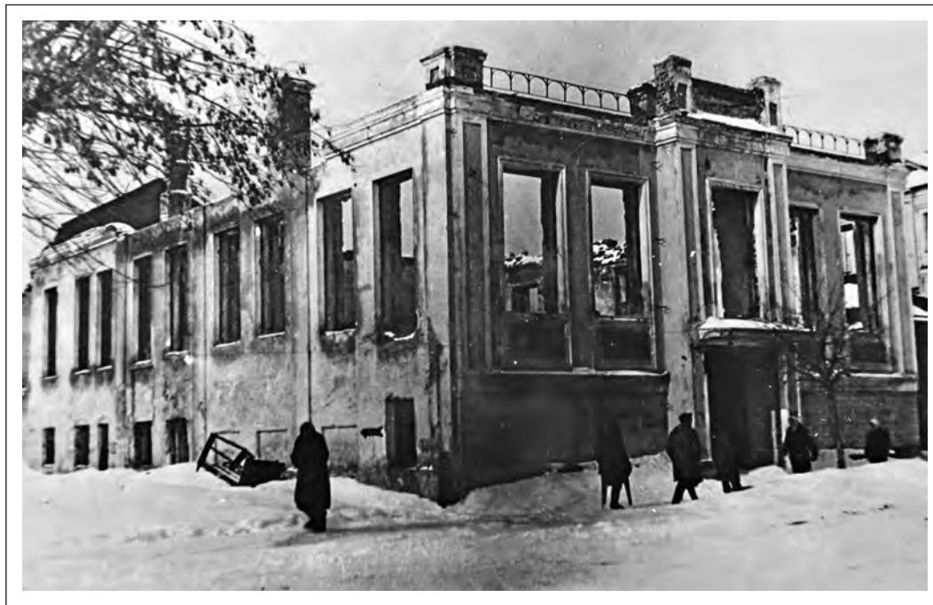
Развалины одной из могилевских синагог на углу улиц Первомайской и Крыленко. После закрытия в 30-х гг. XX в. в ней располагались клуб и ресторан.

После смерти Сталина в годы «оттепели» давление на религиозных евреев немного ослабло. Их, бесспорно, отслеживали, знали все, что происходит в этой среде, но за решетку не бросали, а проводили душещипательные разъяснительные беседы. За-