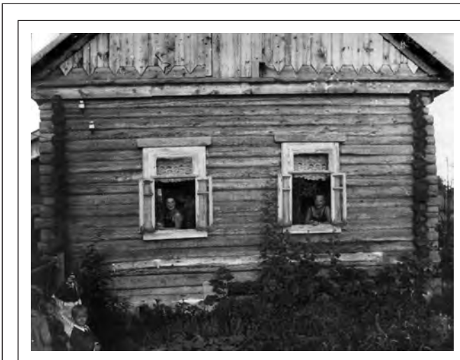
Дом Рыжовых, где изготавливалась маца.

А, в общем-то, если откровенно говорить, всю жизнь презренные... Это не секрет. Если разобратся, то пьяниц в нашей национальности нет, бандитов нет, жуликов тоже. Если б жило больше