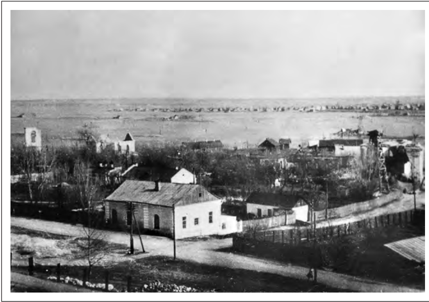
Вид на могилевское Школище и здание старого молеельного дома. В послевоенное время он никогда не использовался по назначению. Фото 50-х гг. XX в.

(основной контингент миньянов) не мог быть применен Указ Президиума Верховного Совета БССР от 15 мая 1961 г. «Об усилении борьбы с лицами, уклоняющимися от общественно полезного труда и ведущими антиобщественный паразитический образ жизни». Не могла к ним применяться и уголовная ответственность, т. к. в их действиях отсутствовал состав преступления. Оставались лишь меры общественного воздействия и предупредительные меры местных органов власти, которые активно применялись в 60-х гг. «В 1962 году, — сообщил уполномоченный в одном из отчетов, — я обратился за помощью в органы прокуратуры. В письме от 26.04.1962 г. указал адреса сборов верующих евреев и руководителей этих молитвенных домов и просил вызвать их в прокуратуру для предупреждения и взятия подписки об этом. Эта моя просьба удовлетворена» (д.26, с.33). В какой-то степени подобная деятельность, по-видимому, приносила свои плоды. По крайней мере, в отчетах цифры верующих неуклонно и резко сокращались. Так, на 01.01.1963 г. в Могилеве их оставалось 40—50 человек (д.26, л.44). В последующие годы о деятельности миньянов сообщается все меньше (возможно, повлиял чисто субъективный фактор — смена уполномоченного), однако в отчете за 1965 г. снова значатся 4 миньяна с общим количеством в 80 верующих (д.34, л.22).