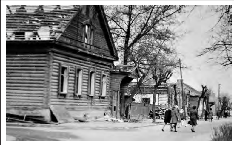
Дом на ул. Миронова, в котором до революции располагалась еврейская больница. Фото 70-х гг. XX в. Филиповича И. из архива Филинова В.

от передков животных, когда животное должно быть зарезано еврейским резником с соблюдением религиозных правил. Это возможно будет делать при наличии "Синагоги".