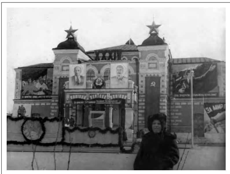
Здание театра перед очередной Октябрьской демонстрацией. Фото начала 50-х гг. XX в.

4,2% вместо 28%(!) в 1947 г., а в Минский институт иностранных языков — 3,5%. В Гомельском педагогическом институте снижение оказалось таким же резким — с 25,3% до 5,2% соответственно. Менее заметно оно было выражено в Витебском пединституте — с 12,5% до 10,1%. На этом фоне аномалией выглядит незначительное увеличение набора студентов-евреев в Могилевский пединститут — с 7,4% до 9%, однако на общую картину по республике этот факт существенного влияния не оказал. А она объяснялась, с одной стороны, предвзятым отношением к еврейским абитуриентам и падением престижа педагогического образования в связи с низким материальным обеспечением школьных учителей, а с другой — выросла смена из белорусских учащихся. Как