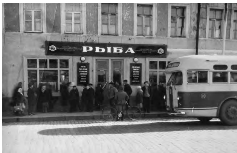
Рыбный магазин на ул. Первомайской. Фото 50-х гг. XX в. из семейного архива Кацмана Л.А.

В первые послевоенные годы мне нередко приходилось видеть на окраинах деревень скромные стандартные стелы с такими надписями: «На этом месте фашисты расстреляли (...) семей евреев, членов нашего колхоза». Потом эти стелы повсеместно исчезли — очевидно, по распоряжению свыше...»