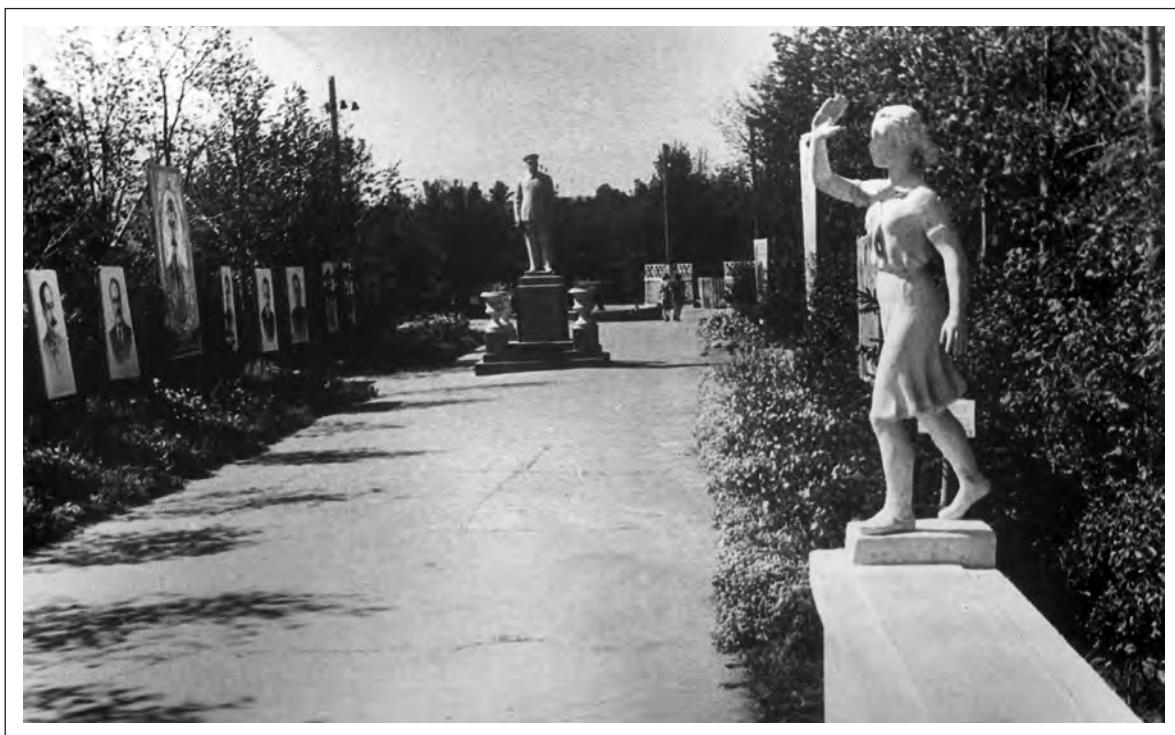
Аллея в городском парке. Фото 50-х гг. XX в. из фондов МОКМ

руководителей кафедр обвинили в неспособности организовать преподавание дисциплин на соответствующем идеологическом уровне. Обращало на себя внимание то, что главными субъектами этой критики стали преподаватели-евреи. В отставании от современности обвинили заведующего кафедрой географии профессора Шенберга , а заведующую