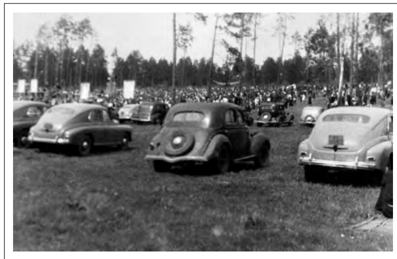
Праздник в Печерском лесопарке. Фото 50-х гг. XX в.

В связи с сообщением ТАСС от 13 января 1953 г. заведующий отделом партийных, профсоюзных и комсомольских органов Могилевского обкома КПБ К. Власов подготовил в ЦК КПСС информацию, в которой говорилось, что митинги в городе по поводу медицинского «террора» врачей-отравителей были «как никогда многолюдны». В медицинских учреждениях Могилева начались собрания с требованием повысить бдительность и улучшить