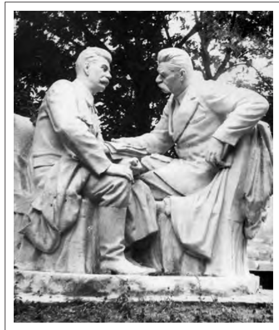
Памятник Сталину и Горькому в городском парке. Фото 50-х гг. XX в.

Прямым результатом кампании против «убийц в белых халатах» стало резкое ограничение приема еврейской молодежи в высшие учебные заведения. Рассмотрим это на примере Могилевского педагогического института. Если принять во внимание, что высшее педагогическое образование в послевоенный период было наиболее массовым и доступным, а среди абитуриентов находились не только жители областных городов, но и районных центров, а также «глубинки», то анализ состава