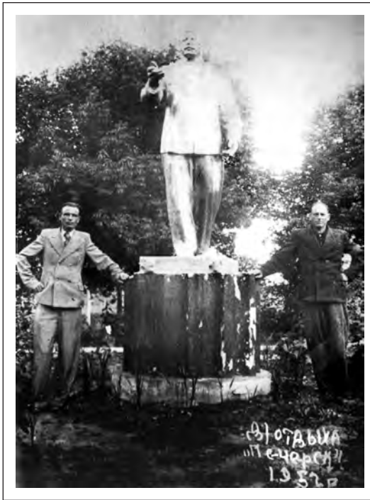
Популярное место фотографирования могилевчан — памятник Сталину в Печерске. Фото 50-х гг. XX в.

Отдельную страницу в истории Могилева открыло «дело врачей» 1953 г. В противостоянии со странами Запада антиеврейская кампания оказа-