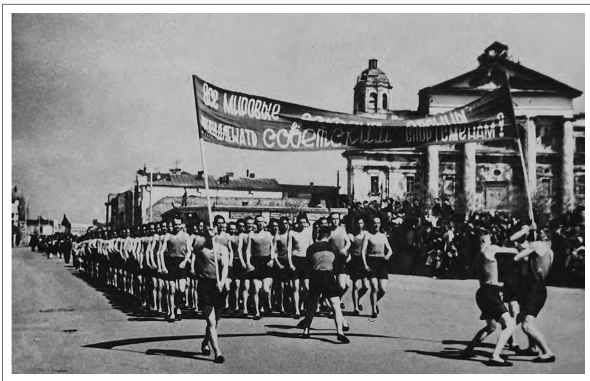
Демонстрация физкультурников. Могилев, 1 мая 1951 г.

обслуживание больных. Могилевский ОК КПБ провел совещание руководителей областного и городского отделов здравоохранения по подбору, расстановке и воспитанию специалистов. Проверка кадров проводилась как в самом Могилеве, так и в семи районах области. Упор делался не только на медицинские, но и торговые, кооперативные организации, где был традиционно высок процент евреев-специалистов (НАРБ, ф.4, оп.62, д.352, л.55).