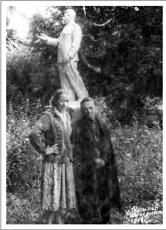
Памятник Сталину в Печерске. Фото 50-х гг. XX в.