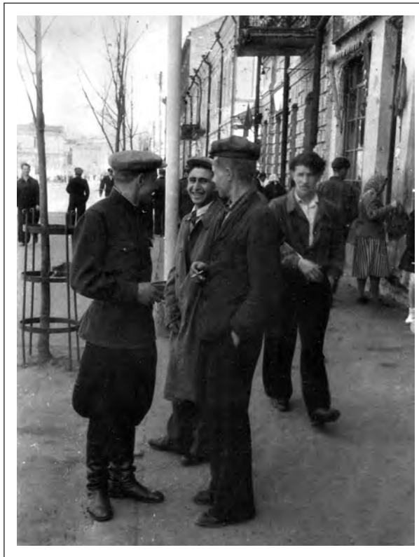
На улице Первомайской.